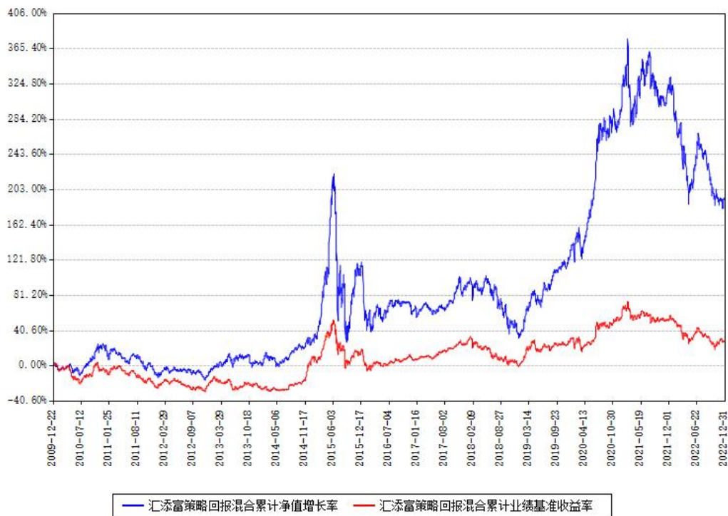
汇添富策略回报混合累计净值增长率与同期业绩比较基准收益率对比图

注：本基金建仓期为本《基金合同》生效之日（2009年12月22日）起6个月，建仓期结束时各项资产配置比例符合合同约定。