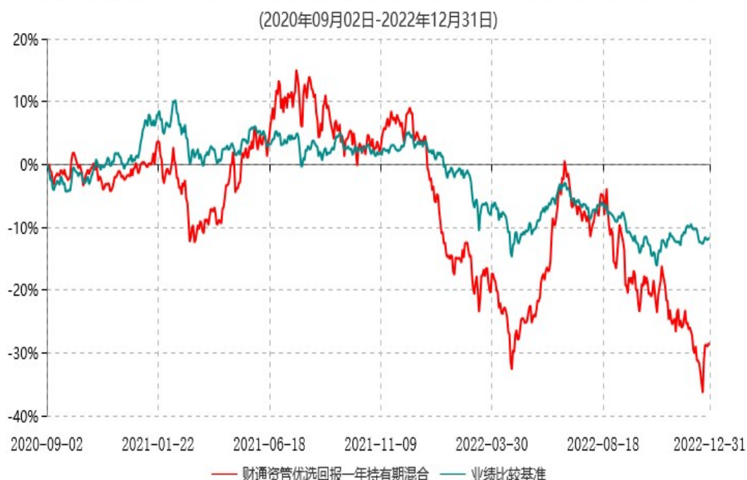
财通资管优选回报一年持有期混合型证券投资基金累计净值增长率与业绩比较基准收益率历史走势对比图