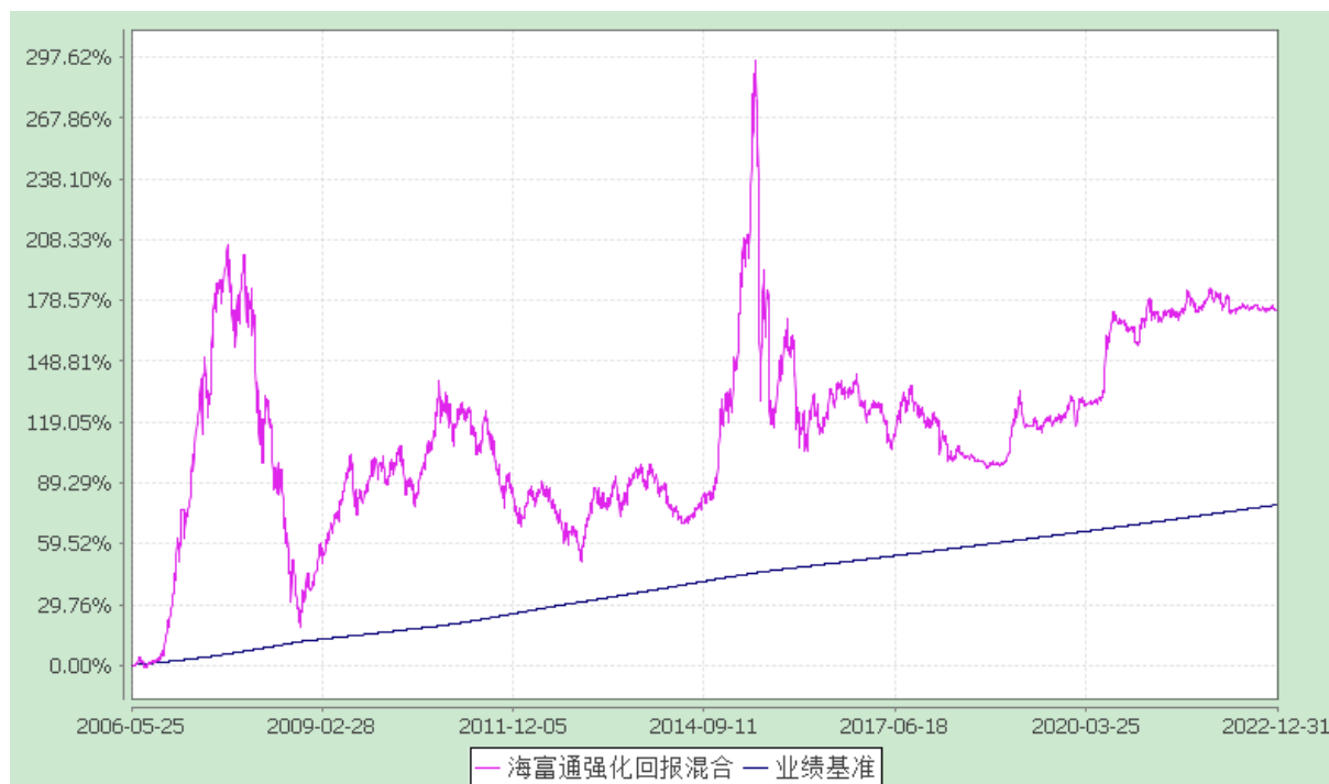
海富通强化回报混合型证券投资基金 份额累计净值增长率与业绩比较基准收益率的历史走势对比图 (2006 年 5 月 25 日至 2022 年 12 月 31 日)

注：按照本基金合同规定,本基金建仓期为基金合同生效之日起六个月。建仓期满至今,本基金投资组合均达到本基金合同第十二条(二)、(七)规定的比例限制及本基金投资组合的比例范围。