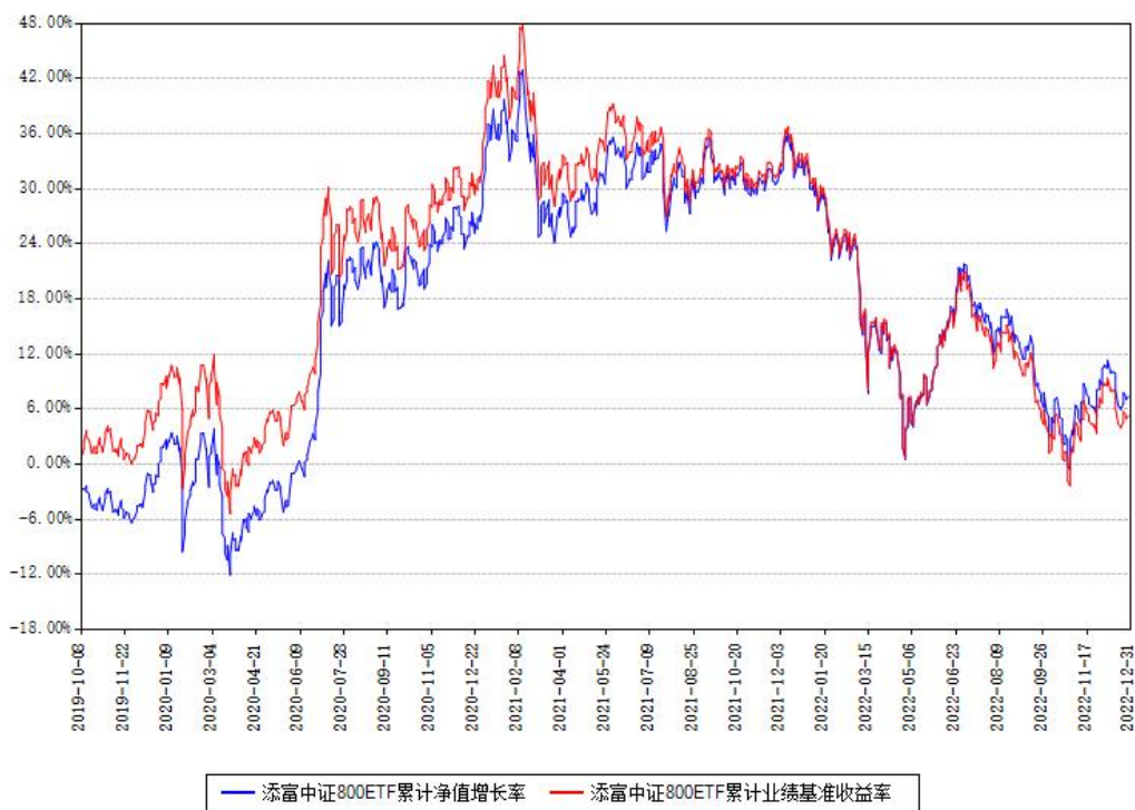
添富中证800ETF累计净值增长率与同期业绩基准收益率对比图

注：本基金建仓期为本《基金合同》生效之日（2019年10月08日）起6个月，建仓期结束时各项资产配置比例符合合同约定。