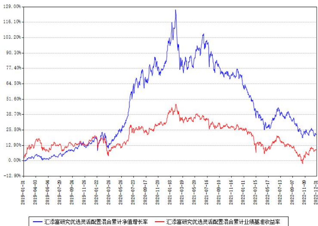
汇添富研究优选灵活配置混合累计净值增长率与同期业绩比较基准收益率对比图

注：本基金建仓期为本《基金合同》生效之日（2019年01月31日）起6个月，建仓期结束时各项资产配置比例符合合同约定。