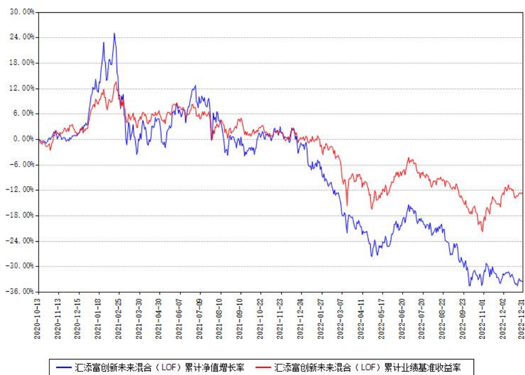
汇添富创新未来混合（LOF）累计净值增长率与同期业绩比较基准收益率对比图

注：本基金建仓期为本《基金合同》生效之日（2020年10月13日）起6个月，建仓期结束时各项资产配置比例符合合同约定。