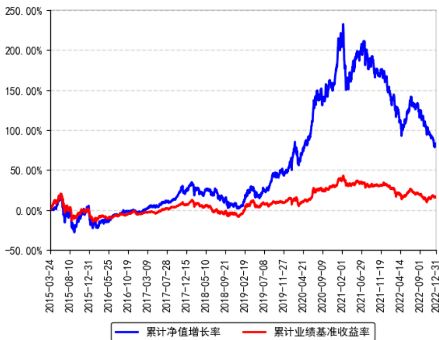
南方创新经济灵活配置混合累计净值增长率与同期业绩比较基准收益率的历史走势对比图