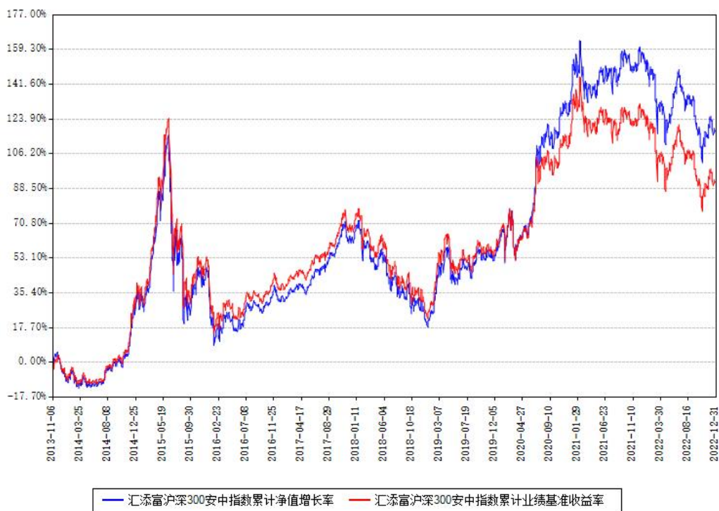
汇添富沪深300安中指数累计净值增长率与同期业绩基准收益率对比图

注：本基金建仓期为本《基金合同》生效之日（2013年11月06日）起6个月，建仓期结束时各项资产配置比例符合合同约定。