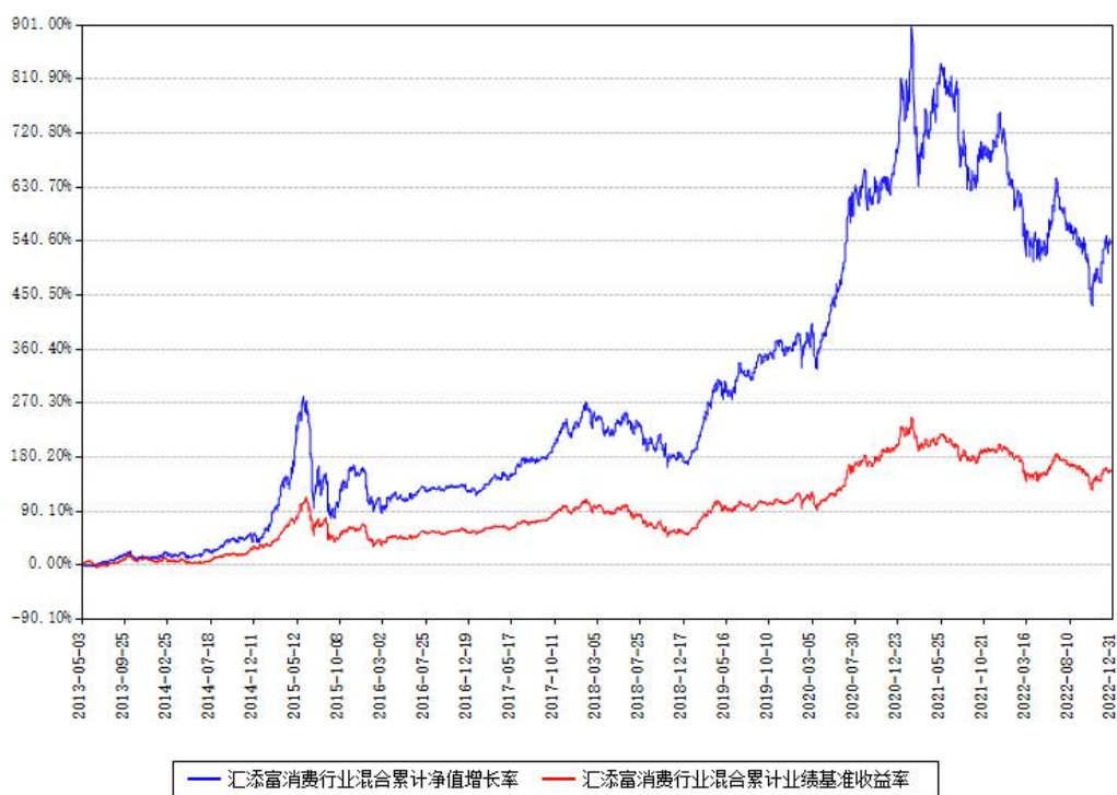
汇添富消费行业混合累计净值增长率与同期业绩基准收益率对比图

注：本基金建仓期为本《基金合同》生效之日（2013年05月03日）起6个月，建仓期结束时各项资产配置比例符合合同约定。