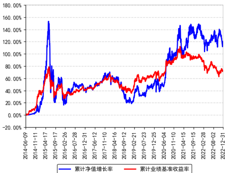
南方中国梦灵活配置混合累计净值增长率与同期业绩比较基准收益率的历史走势对比图