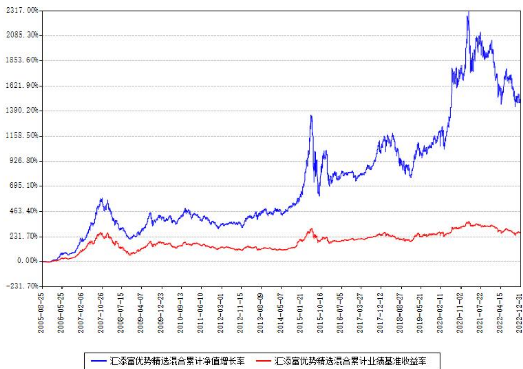
汇添富优势精选混合累计净值增长率与同期业绩比较基准收益率对比图

注：本基金建仓期为本《基金合同》生效之日（2005年08月25日）起6个月，建仓期结束时各项资产配置比例符合合同约定。