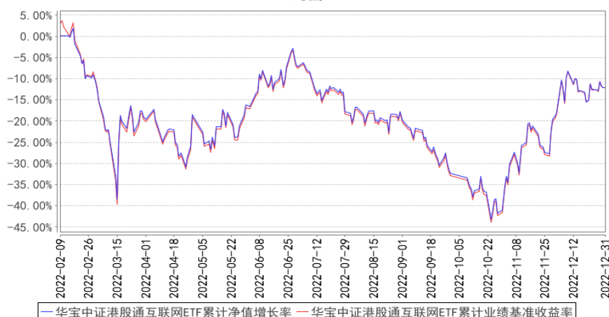
华宝中证港股通互联网ETF累计净值增长率与同期业绩比较基准收益率的历史走势对比图