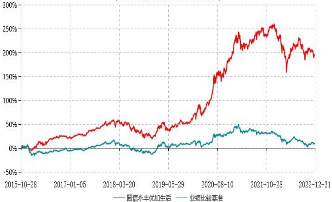
圆信永丰优加生活股票型证券投资基金累计净值增长率与业绩比较基准收益率历史走势对比图 (2015年10月28日-2022年12月31日)