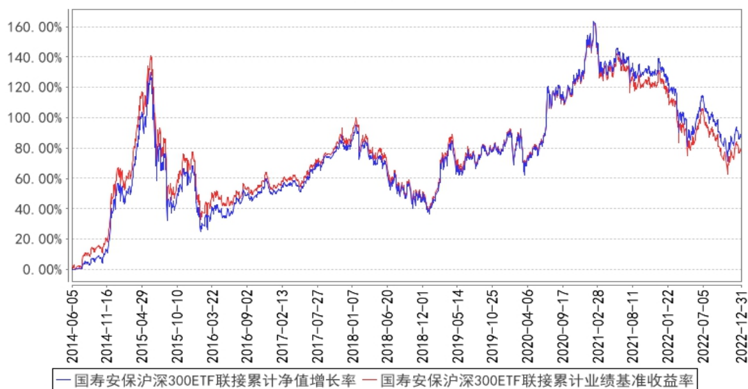
国寿安保沪深300ETF联接累计净值增长率与同期业绩比较基准收益率的历史走势图

注：本基金基金合同生效日为 2014 年 06 月 05 日，按照本基金的基金合同规定，自基金合同生效之日起 6 个月内使基金的投资组合比例符合基金合同关于投资范围和投资限制的有关约定。本基金建仓期结束时各项资产配置比例符合基金合同约定。图示日期为 2014 年 06 月 05 日至 2022 年 12 月 31 日。