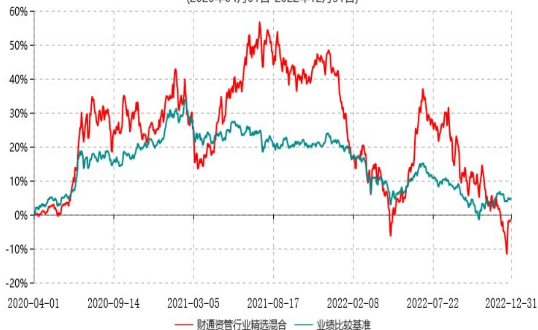
财通资管行业精选混合型证券投资基金累计净值增长率与业绩比较基准收益率历史走势对比图 (2020年04月01日-2022年12月31日)