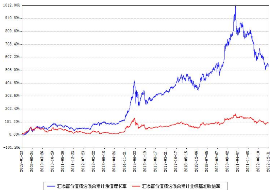
汇添富价值精选混合累计净值增长率与同期业绩比较基准收益率对比图

注：本基金建仓期为本《基金合同》生效之日（2009年01月23日）起6个月，建仓期结束时各项资产配置比例符合合同约定。