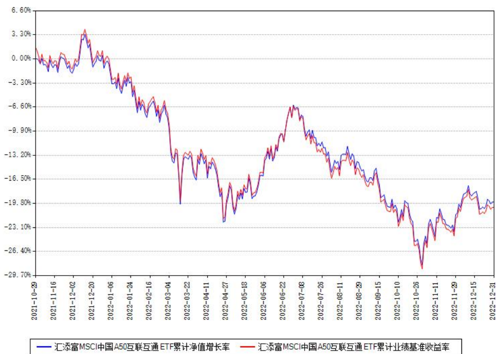
汇添富 MSCI 中国 A50 互联互通 ETF 累计净值增长率与同期业绩基准收益率对比图

注：本基金建仓期为本《基金合同》生效之日（2021年10月29日）起6个月，建仓期结束时各项资产配置比例符合合同约定。