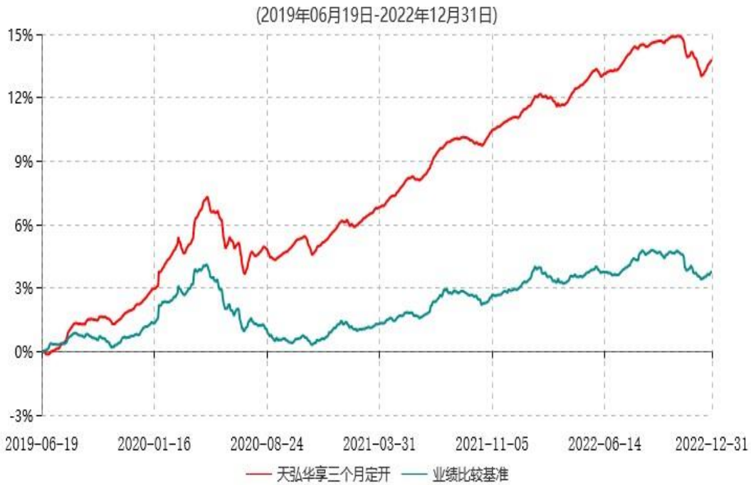
天弘华享三个月定期开放债券型发起式证券投资基金累计净值增长率与业绩比较基准收益率历史走势对比图