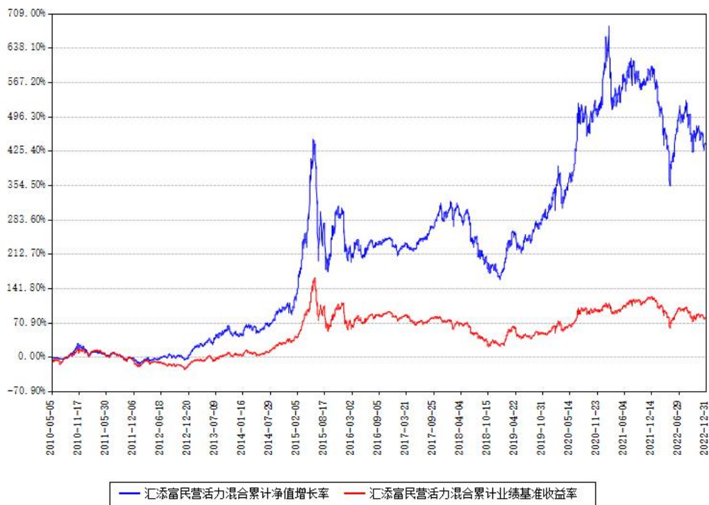
汇添富民营活力混合累计净值增长率与同期业绩比较基准收益率对比图

注：本基金建仓期为本《基金合同》生效之日（2010年05月05日）起6个月，建仓期结束时各项资产配置比例符合合同约定。