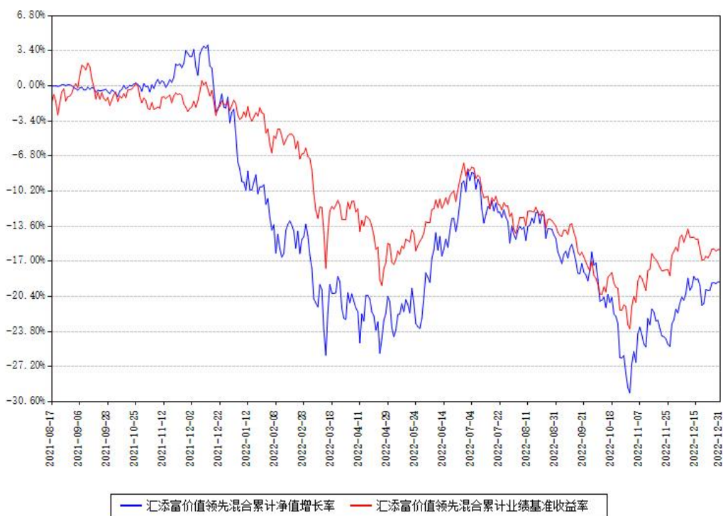
汇添富价值领先混合累计净值增长率与同期业绩基准收益率对比图

注：本基金建仓期为本《基金合同》生效之日（2021年08月17日）起6个月，建仓期结束时各项资产配置比例符合合同约定。