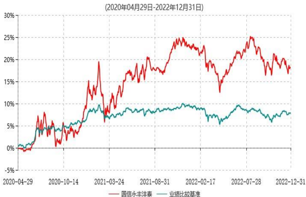
圆信永丰沣泰混合型证券投资基金累计净值增长率与业绩比较基准收益率历史走势对比图