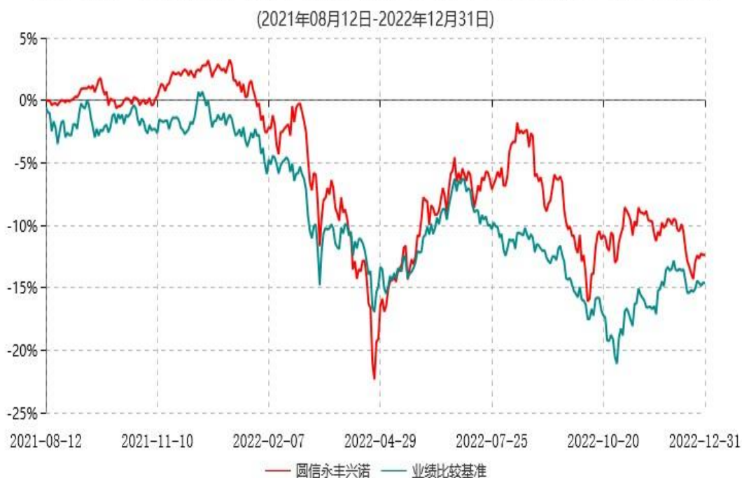
圆信永丰兴诺一年持有期灵活配置混合型证券投资基金累计净值增长率与业绩比较基准收益率历史走势对比图

注：自基金合同生效后，截止报告期末，本基金成立满一年；本基金已完成建仓但报告期末距建仓结束不满一年，建仓结束时各项资产配置比例符合合同约定。