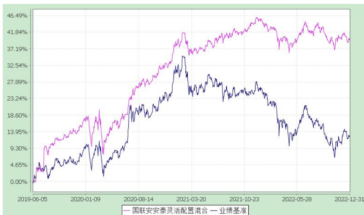
自基金转型以来份额累计净值增长率与业绩比较基准收益率的历史走势对比图 (2019 年 6 月 5 日至 2022 年 12 月 31 日)

注：1、本基金的业绩比较基准为：沪深 300 指数收益率×55%+上证国债指数收益率×45%；