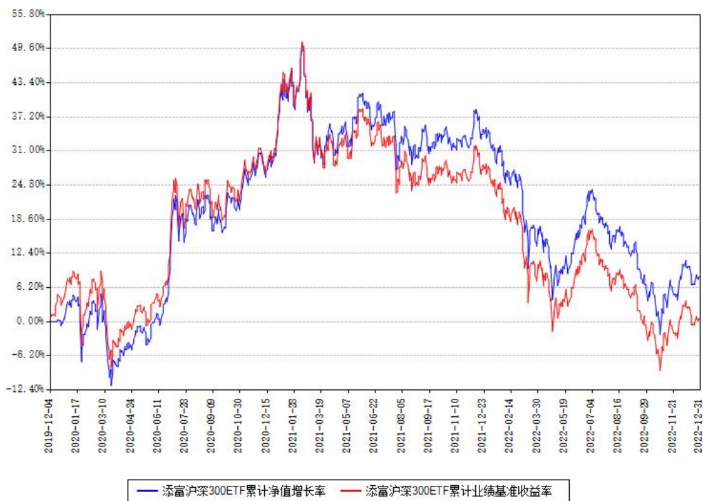
添富沪深300ETF累计净值增长率与同期业绩基准收益率对比图

注：本基金建仓期为本《基金合同》生效之日（2019年12月04日）起6个月，建仓期结束时各项资产配置比例符合合同约定。