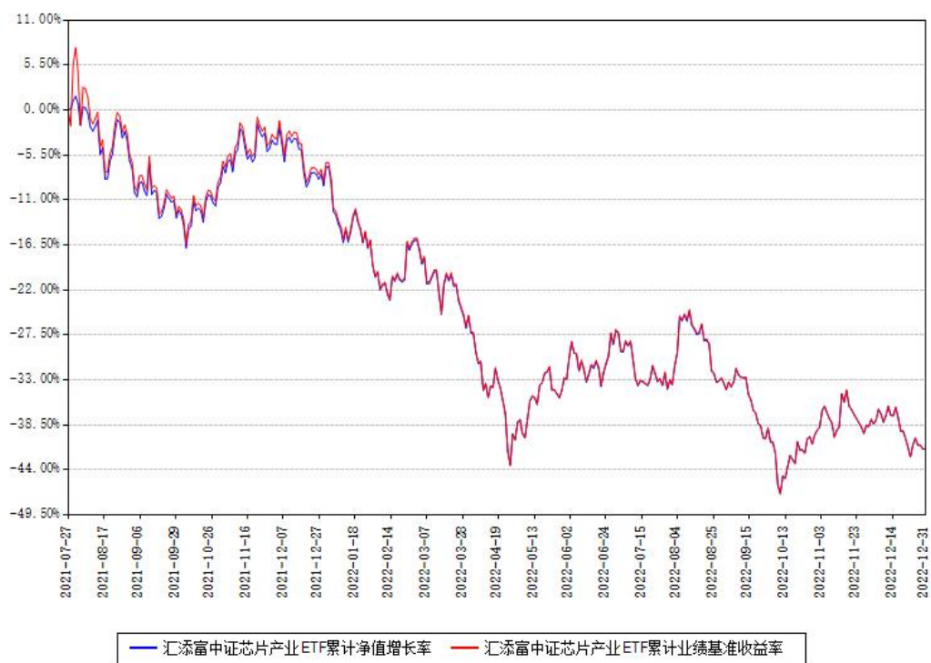
汇添富中证芯片产业ETF累计净值增长率与同期业绩基准收益率对比图

注：本基金建仓期为本《基金合同》生效之日（2021年07月27日）起6个月，建仓期结束时各项资产配置比例符合合同约定。