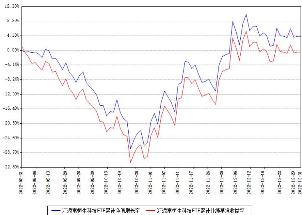
汇添富恒生科技ETF累计净值增长率与同期业绩基准收益率对比图

注：本《基金合同》生效之日为 2022 年 08 月 31 日，截至本报告期末，基金成立未满一年。