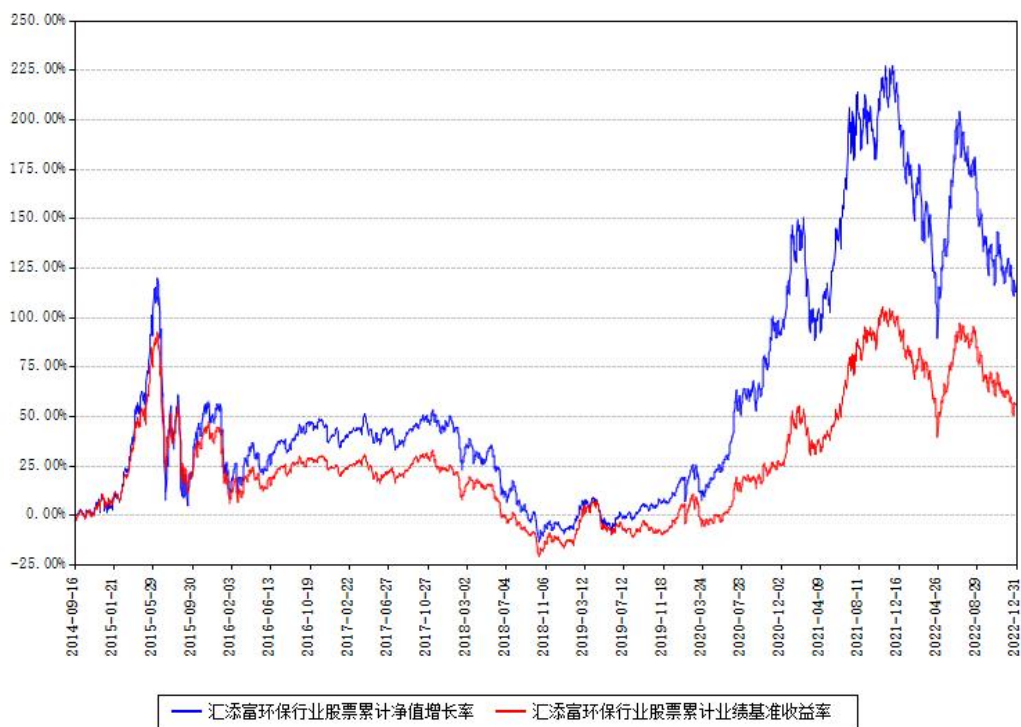
汇添富环保行业股票累计净值增长率与同期业绩基准收益率对比图

注：本基金建仓期为本《基金合同》生效之日（2014年09月16日）起6个月，建仓期结束时各项资产配置比例符合合同约定。