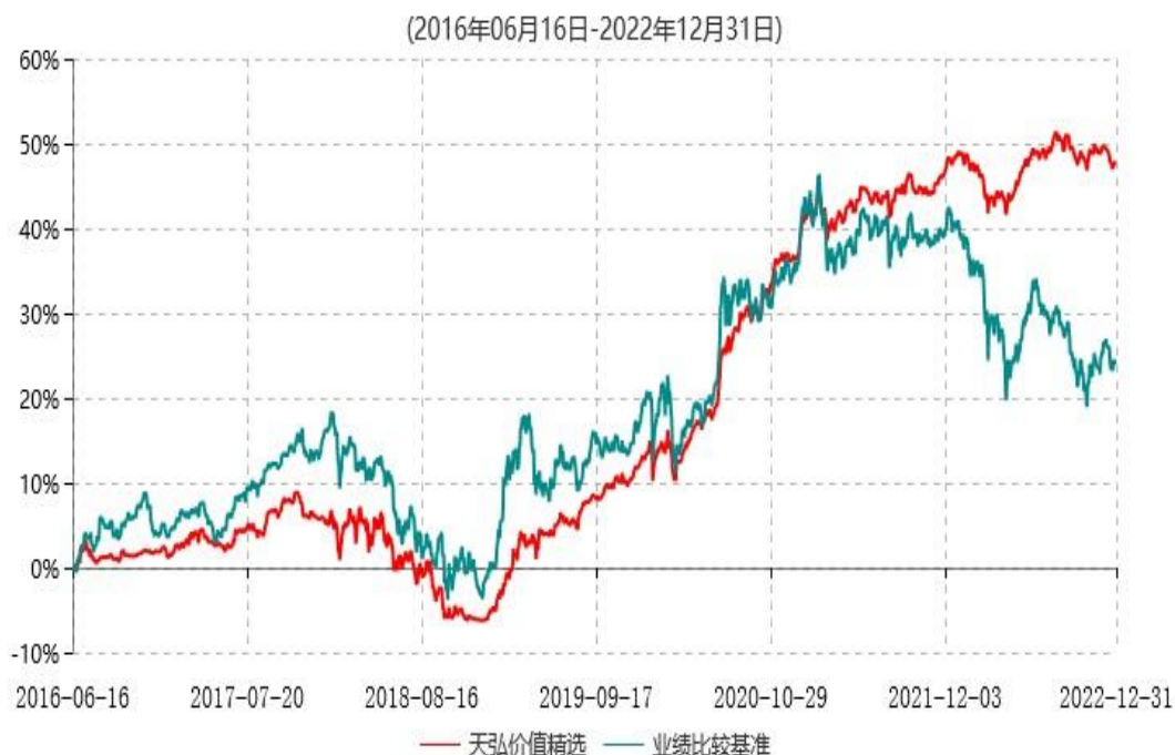
天弘价值精选灵活配置混合型发起式证券投资基金累计净值增长率与业绩比较基准收益率历史走势对比图