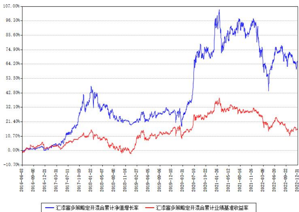
汇添富多策略定开混合累计净值增长率与同期业绩基准收益率对比图

注：本基金建仓期为本《基金合同》生效之日（2016年06月03日）起6个月，建仓期结束时各项资产配置比例符合合同约定。