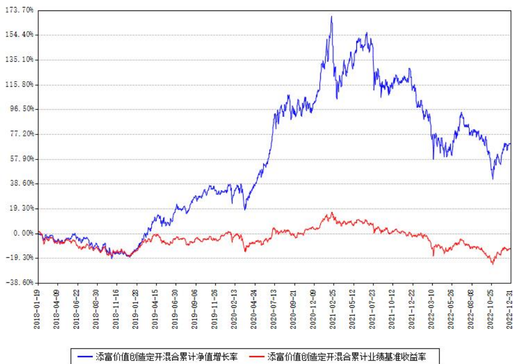
添富价值创造定开混合累计净值增长率与同期业绩比较基准收益率对比图

注：本基金建仓期为本《基金合同》生效之日（2018年01月19日）起6个月，建仓期结束时各项资产配置比例符合合同约定。