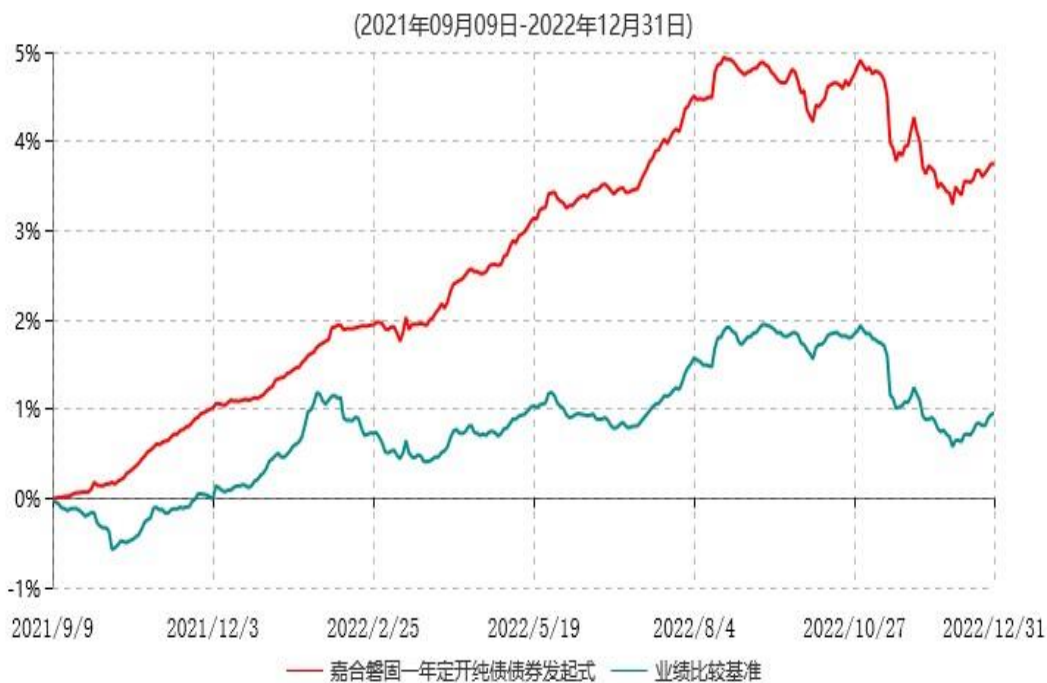
嘉合磐固一年定期开放纯债债券型发起式证券投资基金累计净值增长率与业绩比较基准收益率历史走势对比图

注：本基金合同于2021年9月9日生效，按基金合同规定，本基金自合同生效起6个月内为建仓期。建仓期结束时，本基金的各项资产配置比例符合基金合同约定。