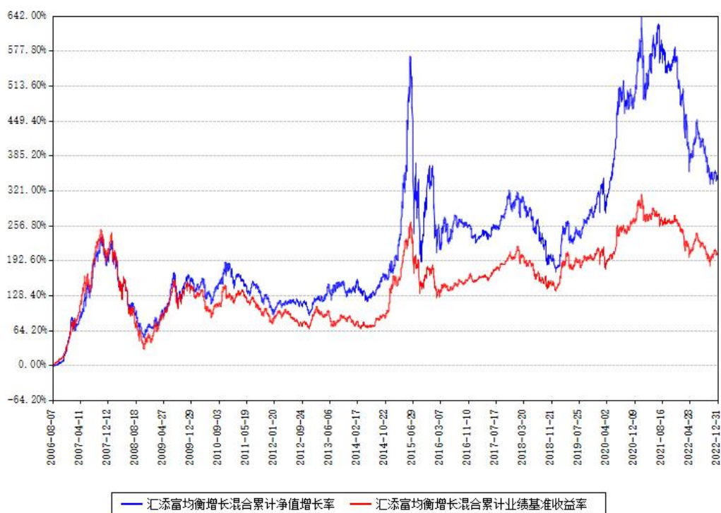
汇添富均衡增长混合累计净值增长率与同期业绩基准收益率对比图

注：本基金建仓期为本《基金合同》生效之日（2006年08月07日）起6个月，建仓期结束时各项资产配置比例符合合同约定。