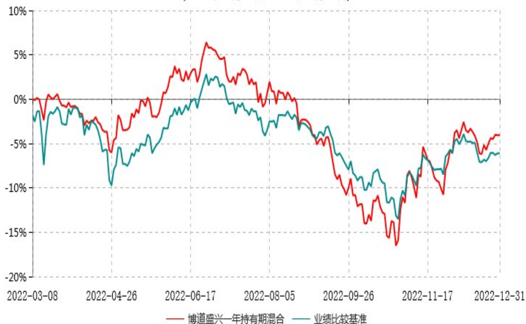
博道盛兴一年持有期混合型证券投资基金累计净值增长率与业绩比较基准收益率历史走势对比图 (2022年03月08日-2022年12月31日)