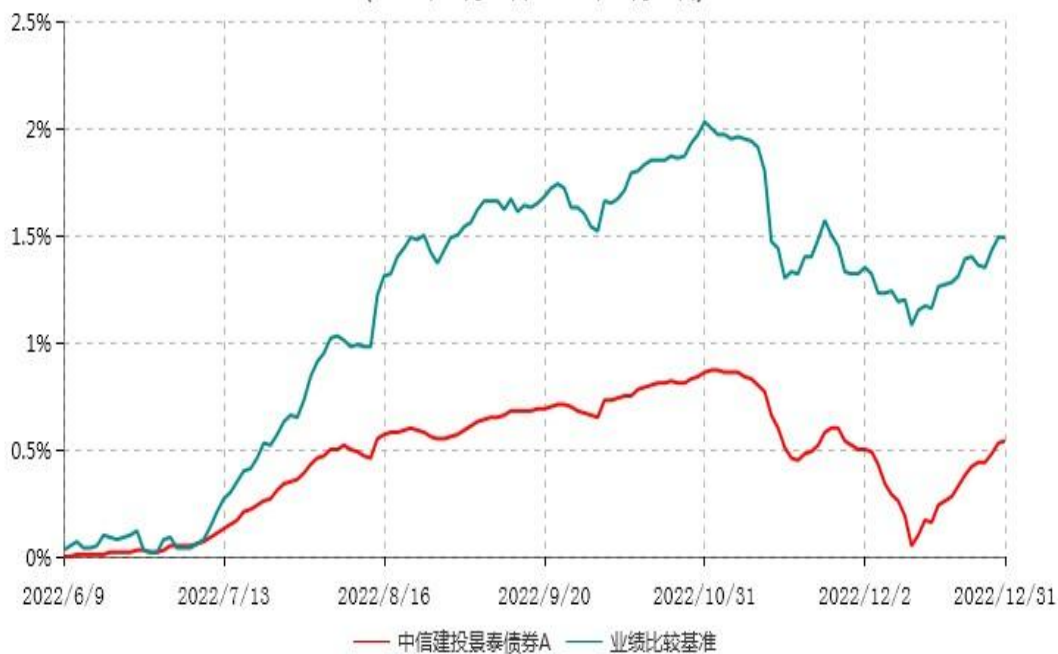
中信建投景泰债券A累计净值增长率与业绩比较基准收益率历史走势对比图 (2022年06月09日-2022年12月31日)