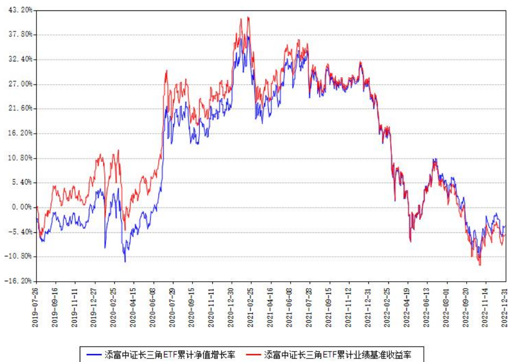
添富中证长三角ETF累计净值增长率与同期业绩基准收益率对比图

注：本基金建仓期为本《基金合同》生效之日（2019年07月26日）起6个月，建仓期结束时各项资产配置比例符合合同约定。