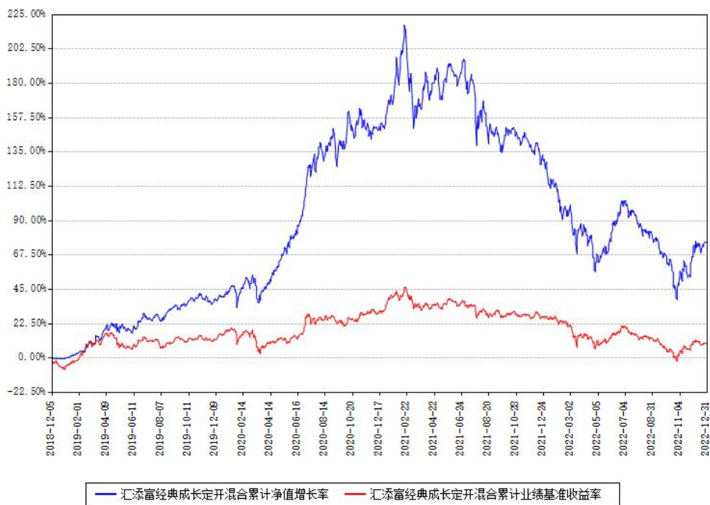
汇添富经典成长定开混合累计净值增长率与同期业绩比较基准收益率对比图

注：本基金建仓期为本《基金合同》生效之日（2018年12月05日）起6个月，建仓期结束时各项资产配置比例符合合同约定。