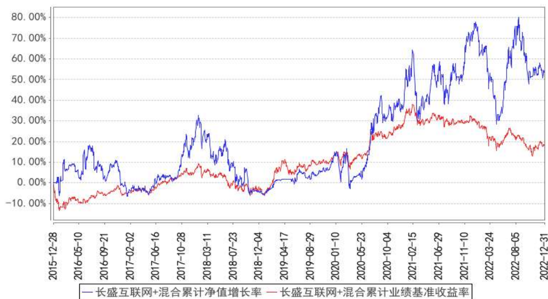
长盛互联网+混合累计净值增长率与同期业绩比较基准收益率的历史走势对比图

注：按照本基金合同规定，本基金基金管理人应当自基金合同生效之日起六个月内使基金的投资组合比例符合基金合同的约定。截至报告日，本基金的各项资产配置比例符合基金合同的有关约定。