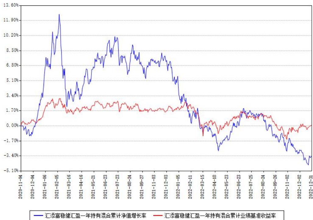
汇添富稳健汇盈一年持有混合累计净值增长率与同期业绩基准收益率对比图

注：本基金建仓期为本《基金合同》生效之日（2020年11月04日）起6个月，建仓期结束时各项资产配置比例符合合同约定。