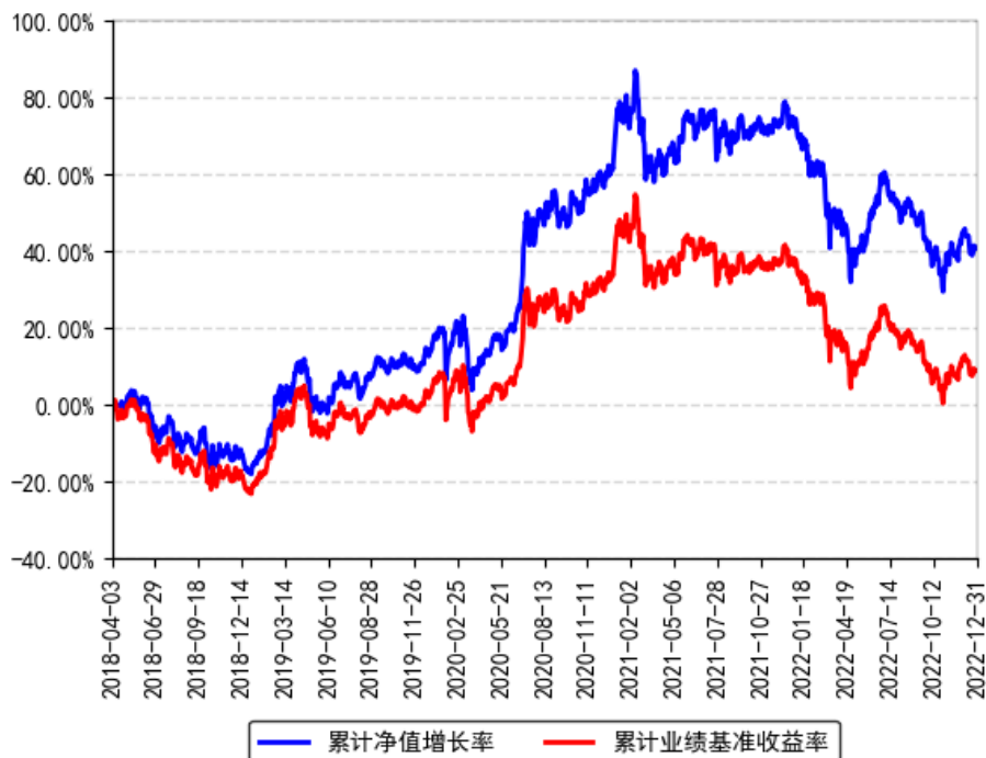
南方MSCI中国A股国际通ETF累计净值增长率与同期业绩比较基准收益率的历史走势对比图