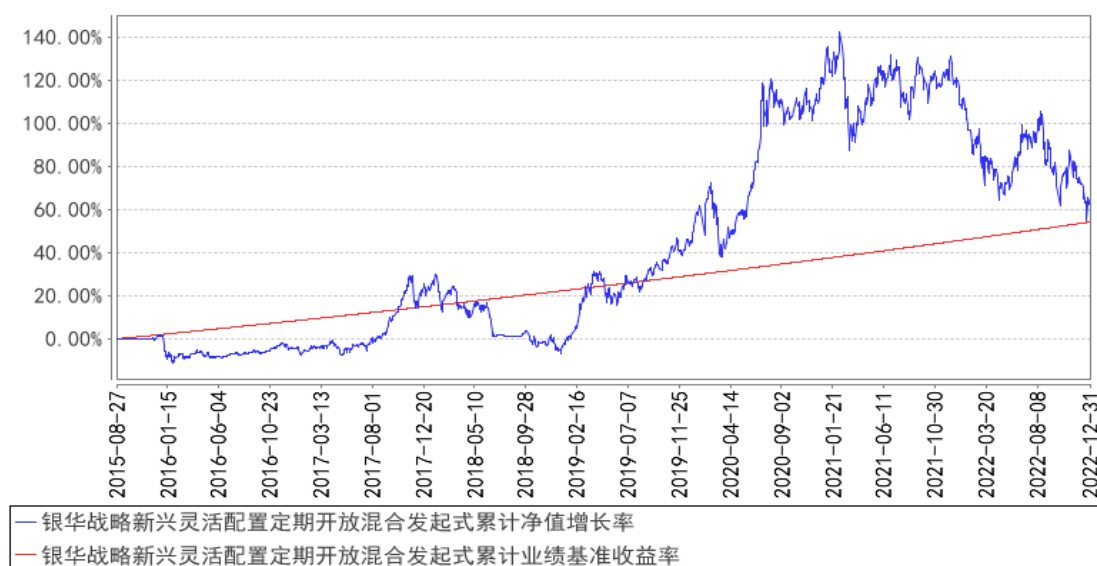
银华战略新兴灵活配置定期开放混合发起式累计净值增长率与同期业绩比较基准收益率的历史走势对比图

注：按基金合同的规定，本基金自基金合同生效起六个月内为建仓期，建仓期结束时本基金的各项投资比例已达到基金合同的规定：在开放期内股票投资比例为基金资产的 0%-95%，在封闭期内股票投资比例为基金资产的 0%-100%；权证投资比例为基金资产净值的 0%-3%。