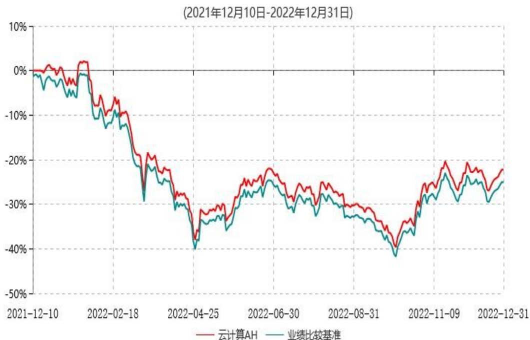
天弘中证沪港深云计算产业交易型开放式指数证券投资基金累计净值增长率与业绩比较基准收益率历史走势对比图