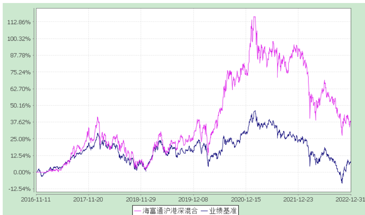
海富通沪港深灵活配置混合型证券投资基金 份额累计净值增长率与业绩比较基准收益率的历史走势对比图 (2016年11月11日至2022年12月31日)

注：本基金合同于2016年11月11日生效。按基金合同规定，本基金自基金合同生效起6个月内为建仓期。建仓期结束时本基金的各项投资比例已达到基金合同第十二部分（二）投资范围、（四）投资限制中规定的各项比例。