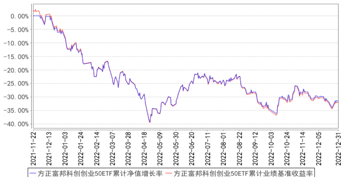
方正富邦科创创业50ETF累计净值增长率与同期业绩比较基准收益率的历史走势对比图

注：按基金合同和招募说明书的约定，自基金合同生效之日起六个月内使基金的投资组合比例符合本基金合同(第十四部分二、投资范围，三、投资策略和四、投资限制)的有关约定。