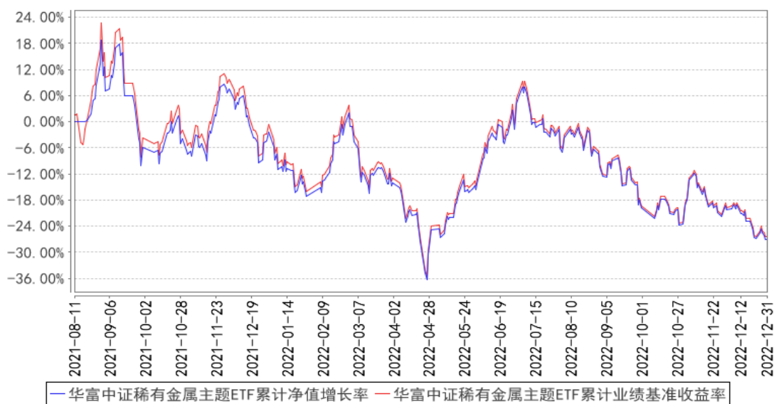
华富中证稀有金属主题ETF累计净值增长率与同期业绩比较基准收益率的历史走势图

注：根据《华富中证稀有金属主题交易型开放式指数证券投资基金》的规定，本基金的投资组合比例为：本基金投资于标的指数成份股和备选成份股的资产比例不低于基金资产净值的90%，且投资于标的指数成份股和备选成份股的资产比例不低于非现金基金资产的80%；股指期货及其他金融工具的投资比例依照法律法规或监管机构的规定执行。本基金建仓期为2021年8月11日到2022年2月11日，建仓期结束各项资产配置比例符合合同约定。本报告期，本基金严格执行了《华富中证稀有金属主题交易型开放式指数证券投资基金》的相关规定。