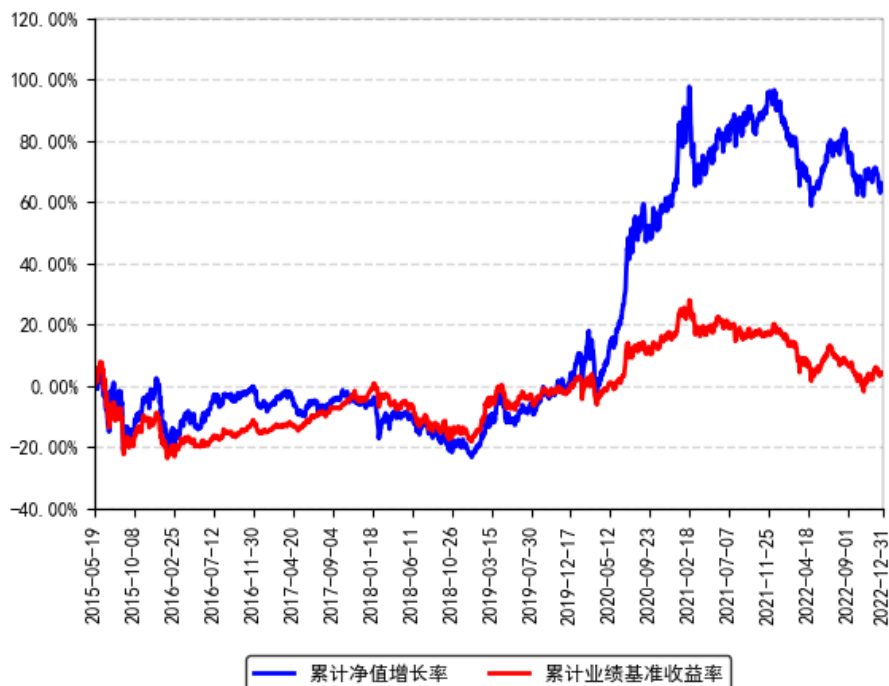
南方改革机遇灵活配置混合累计净值增长率与同期业绩比较基准收益率的历史走势对比图