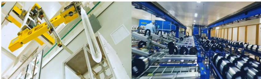
光纤预制棒及光纤

在预制棒及光纤板块，公司加大了新产品、新技术的研发和推广力度，产品结构持续优化。在成本控制方面，公司合理利用不同生产工艺的比较优势，改善了生产效率及成本。2022 年度，公司预制棒及光纤分部毛利率为 47.53%。