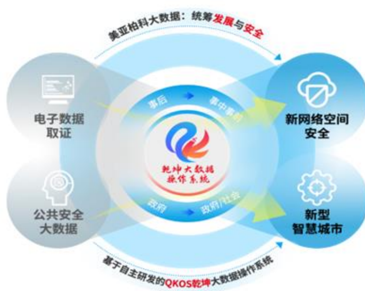
美亚柏科主营业务图

在基石业务领域，公司通过 1+1+1...+1=N 的方式发展，在创新赛道领域，公司通过“乾坤”大数据操作系统（QKOS）的核心能力，将实现 N \times N \cdots \times N = N^N 的倍增增长。