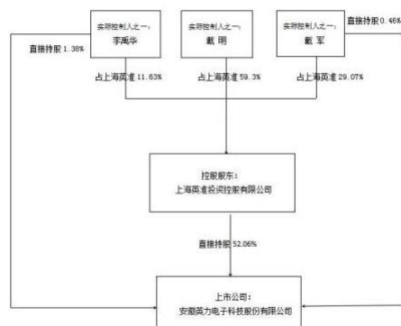
公司与实控人之间产权及控制关系的方框图