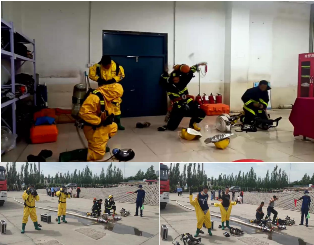
三聚家景组织参加阿拉善高新区应急比武大赛活动