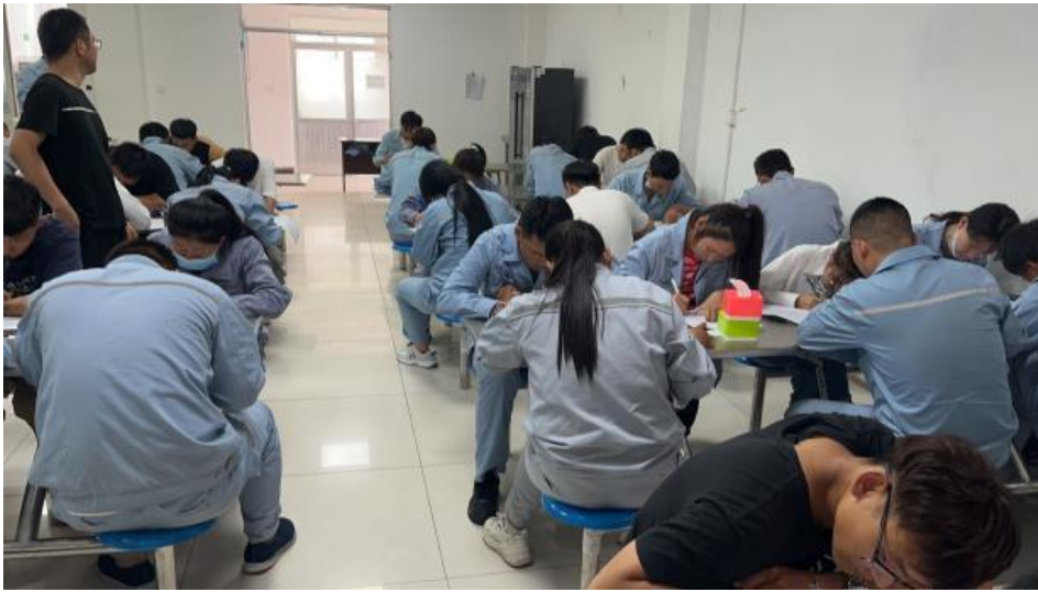
四川鑫达组织应急演练及安全环保知识竞赛活动