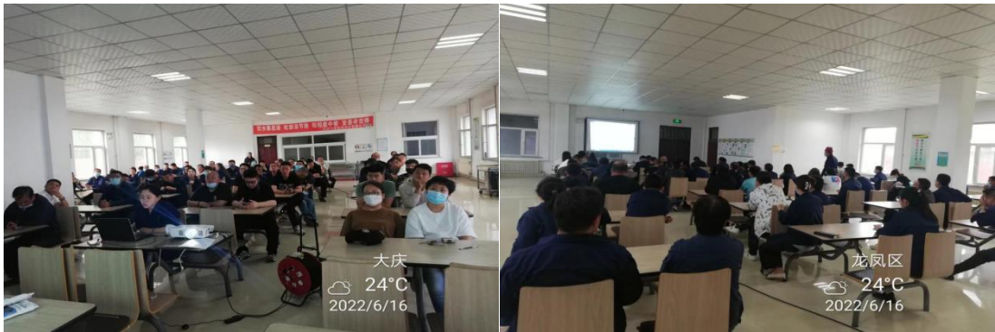
大庆三聚安全生产月职业健康与急救培训

于安全生产重要论述的理解，牢固树立安全发展理念，增强从根本上消除事故隐患的思想自觉和行动自觉；开展“排查整治进行时”专题活动，排查固定及非固定工作场所的安全隐患。