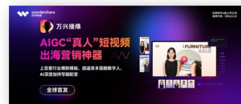
图4 万兴播爆新品首发上线

绘图创意产品线: 报告期内, 公司持续优化多端产品功能、增强云端协同创作能力、丰富模板资源素材、加强办公场景生态建设, 提升产品用户体验。