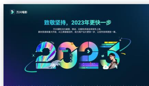
图2 万兴喵影2023重磅发布