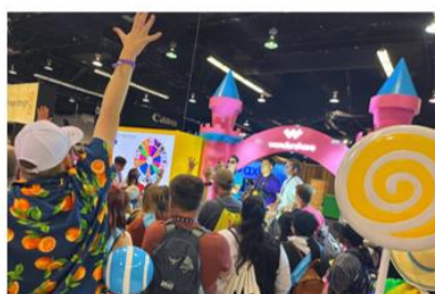
图17 公司参与全球创作者顶级盛会VidCon