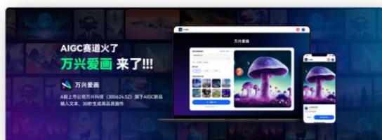
图7 万兴爱画全新发布