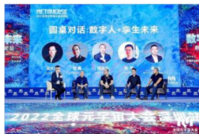
图18 公司联合举办2022全球元宇宙大会·数字人技术与应用场景论坛