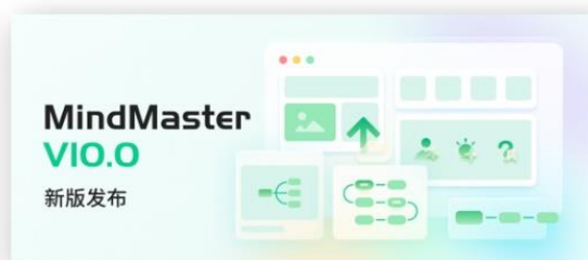
图6 亿图脑图V10.0更新上线