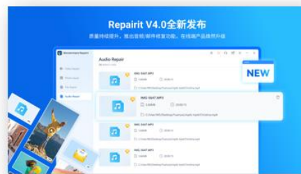
图13 Repairit V4 全渠道发布