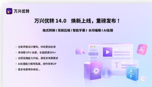
图3 万兴优转 V14.0版本焕新升级