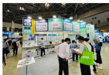
图19 公司参与日本第五届地方政府·公众周展会

公司持续关注企业需求，挖掘不同企业用户办公场景，持续打磨产品通用功能，并提供定制化开发与适配服务，深化公司产品在多个垂直领域的延伸应用，并积极拓展渠道触达更多企业用户。市场方面，公司在日本东京参加面向政府、机关单位的政企贸易展——第五届地方政府·公众周展会，全力支持全球范围内的政企合作，积极助力政企数字化转型。客户方面，公司新增合作了中国联通、中船重工、河南中烟、上海烟草机械等央国企，积极拓展一汽丰田、欣旺达、联合国教科文组织高等教育创新中心、迪拜警察局等海内外企业与政府客户，持续夯实政企业务布局，为后续垂类业务拓展奠定客群基础。报告期内，公司新拓展第三方代理商数量同比增长158%，对应业务贡献同比增长35%，政企营销策略收效明显。