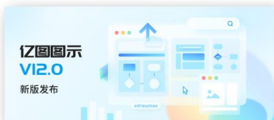
图5 亿图图示V12.0更新上线

2022年11月，AIGC领域新品万兴爱画小程序首发上线，用户输入一段文字即可获得不同比例和多种艺术风格的AI绘画作品，目前已支持AI文字绘画、AI以图绘图、AI简笔画三种创作模式和小程序、移动端和网页端多端畅享体验，助力普通用户利用AI能力，智能生成高质量艺术绘画创作。