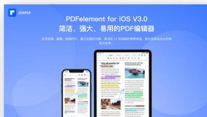
图10 PDFelement移动端 V3.0全新发布