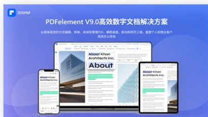
图9 PDFelement V9.0全新发布

文档创意产品线： 报告期内，公司进一步夯实文档创意产品多端服务体系，优化产品结构 with 功能，打造智慧文档服务解决方案。万兴PDF（英文名称：PDFelement）完成桌面端9.0大版本，ios移动端3.0版本，云端产品HiPDF 3.0版本多端产品的全面更新，重塑信息架构，引入AI技术，新增翻译等专业功能，构建夯实文档上云、文档共享，文档同步的“Win+Mac+云”三端一体服务体系，优化界面设计，初步实现从PDF处理工具向一体化的智慧文档服务的转型。