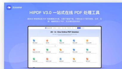
图11 云端产品HiPDF V3.0焕新发布

实用工具产品线： 报告期内，公司优化实用工具产品性能，拓宽使用场景，发力移动端数据产品潜力，提升产品价值和影响力。万兴恢复专家（英文名称：Recoverit）完成V11版本更新，推出全新高阶恢复功能，提升了用户视频和图片文件恢复成功率；万兴易修（英文名称：Repairit）V4.0版本继续深化视频、音频和图片领域的修复能力，不断增强修复效果。2022年8月，公司还全新发布Repairit for Email、Repairit Online两款新品，拓展邮箱内修复场景和在线端视频、图片、文档修复场景。此外，公司大力强化移动端数据产品的竞争实力，推出Dr. Fone移动版，提供多项专业功能；MobileTrans重塑产品定位，探索更多移动端使用场景，拓展产品市场空间；推出家庭安全类产品Geonnection、相册清理产品MobileClean等产品，进一步拓展移动端产品市场，满足更多用户场景需求。