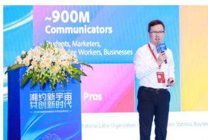
图16 公司承办2022互联网岳麓峰会元宇宙专场论坛

报告期内，公司携旗下多款产品亮相在美国洛杉矶举办的全球创作者顶级盛会VidCon，并面向全球发布首个大型、沉浸式元宇宙创作者俱乐部——Wondershare Creator Club (万兴科技创作者俱乐部)，积极探索为新时代新潮流的创作者持续创意赋能；公司承办2022互联网岳麓峰会·元宇宙专场论坛，与国内产、学、研领域专家领袖共话新兴产业与行业趋势；公司联合中国移动通信举办2022全球元宇宙大会·数字人技术与应用场景论坛，与业内企业共同探讨数字人发展机遇。