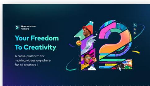
图1 Filmora V12.0版本重大升级

7月, 公司在国内正式推出正版素材资源商城——万兴喵库, 致力于打造高端正版视频素材资源平台, 为国内视频创作者提供海量、正版、优质、个性化的创意素材服务。公司不断丰富深化行业模板、提升素材资源数量与质量, 通过自产+供应商合作+外包等多种生产方式, 为用户提供海量视频、音频、图片、文字、特效等多种优质资源内容, 提升对垂直场景的资源精准赋能。报告期内, 公司进一步加大素材资源建设力度, 基于原创素材资源商城Filmstock升级构建一体化资源平台Wonstock, 并完成1.0建设上线, 实现更高效、更严格的资源数据服务与管理, 全年实现资源素材销售收入同比增长达74%。