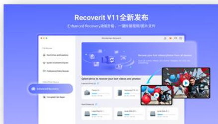
图12 Recoverit V11全渠道发布